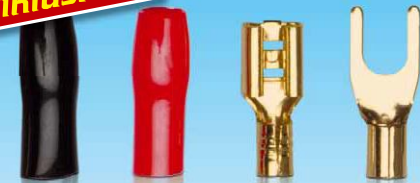
4x Gabelkabelschuh, 2x 4,8mm Flachstecker, 2x 2,8mm Flachstecker. Alle Kontakte 24 Karat vergoldet!